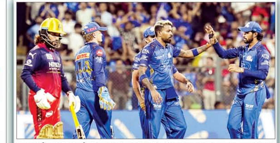
ਆਈ.ਪੀ.ਐਲ ਦਾ 20ਵਾਂ ਮੈਚ ਮੁੰਬਈ ਦੇ ਵਾਨਖੇਡੇ ਸਟੇਡੀਅਮ ਵਿਖੇ ਮੁੰਬਈ ਤੋਂ ਬੰਗਲੁਰੂ ਵਿਚਕਾਰ ਖੇਡਿਆ ਗਿਆ। ਬੰਗਲੁਰੂ ਨੇ ਪਹਿਲਾਂ ਬੱਲੇਬਾਜ਼ੀ ਕਰਦਿਆਂ ਮੁੰਬਈ ਨੂੰ 241 ਦੌੜਾਂ ਦਾ ਟੀਚਾ ਦਿਤਾ। ਖ਼ਬਰ ਲਿਖੇ ਜਾਣ ਤਕ ਮੁੰਬਈ 6 ਓਵਰਾਂ 'ਚ 62 ਦੌੜਾਂ ਬਣਾ ਲਈਆਂ ਸਨ। (ਪੀ.ਟੀ.ਆਈ.)

ਵਾਸ਼ਿੰਗਟਨ, 12 ਅਪ੍ਰੈਲ : ਅਮਰੀਕੀ ਰਾਸ਼ਟਰਪਤੀ ਨੇ ਕਿਹਾ ਕਿ ਜੇਕਰ ਚੀਨ ਨੇ ਇਰਾਨ ਨੂੰ ਹਥਿਆਰ ਵੇਚੇ ਤਾਂ ਉਸ 'ਤੇ 50 ਫ਼ੀ ਸਦੀ ਟੈਰਿਫ਼ ਲਗਾਇਆ ਜਾਵੇਗਾ। ਟਰੰਪ ਨੇ ਫ਼ੌਕਸ ਨਿਊਜ਼ ਦੇ 'ਸੋਡੇ ਮਾਰਨਿੰਗ ਵਿਊਚਰਜ਼' ਨੂੰ ਦਸਿਆ ਕਿ ਉਨ੍ਹਾਂ ਨੇ ਚੀਨ ਵਲੋਂ ਇਰਾਨ ਨੂੰ ਹਵਾਈ ਜਹਾਜ਼ ਮਾਰਨ ਵਾਲੇ ਹਥਿਆਰ ਦੇਣ ਦੀਆਂ ਖ਼ਬਰਾਂ ਸੁਣੀਆਂ ਹਨ। ਉਨ੍ਹਾਂ ਨੇ ਚੀਨ ਦੇ ਇਰਾਨ ਨੂੰ ਹਥਿਆਰ ਸਪਲਾਈ ਕਰਨ ਦੀ ਸੰਭਾਵਨਾ ਨੂੰ ਰੱਦ ਕਰ ਦਿਤਾ, ਪਰ ਕਿਹਾ ਕਿ ਜੇ ਉਨ੍ਹਾਂ ਨੇ ਅਜਿਹਾ ਕੀਤਾ ਤਾਂ ਉਨ੍ਹਾਂ ਦੇ ਮਾਲ ਉਤੇ ਟੈਕਸ ਲਗਾਇਆ ਜਾਵੇਗਾ। ਟਰੰਪ ਨੇ ਕਿਹਾ, "ਮੈਨੂੰ ਸ਼ੱਕ ਹੈ ਕਿ ਉਹ ਅਜਿਹਾ ਕਰਨਗੇ, ਕਿਉਂਕਿ ਮੈਨੂੰ ਲਗਦਾ ਹੈ ਕਿ ਉਹ ਅਜਿਹਾ ਨਹੀਂ ਕਰਨਗੇ। ਪਰ ਜੇ ਅਸੀਂ ਉਨ੍ਹਾਂ ਨੂੰ ਅਜਿਹਾ ਕਰਦੇ ਹੋਏ ਫੜ ਲਿਆ ਤਾਂ ਉਨ੍ਹਾਂ ਉਤੇ 50% ਟੈਰਿਫ਼ ਲੱਗੇਗਾ।" (ਪੀ.ਟੀ.ਆਈ.)